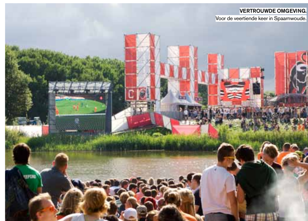
VERTROUWDE OMGEVING. Voor de veertiende keer in Spaarnwoude.