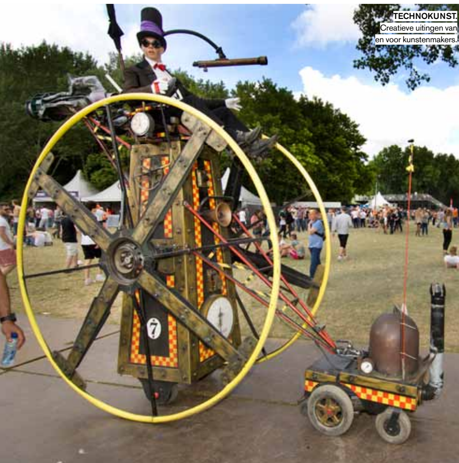
TECHNOKUNST. Creatieve uitingen van en voor kunstmakers.