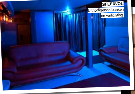
SFEERVOL Uitnodigende banken en verlichting.