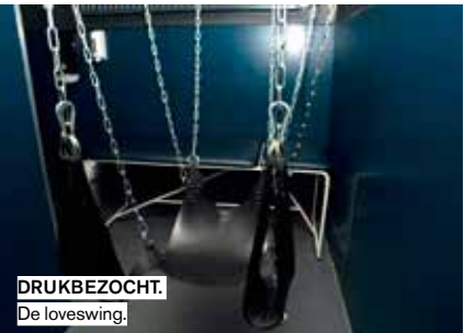
DRUKBEZOCHT. De loveswing.