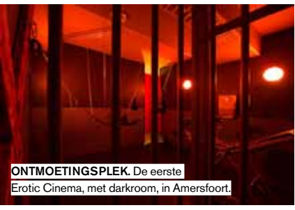
ONTMOETINGSPLEK. De eerste Erotic Cinema, met darkroom, in Amersfoort.