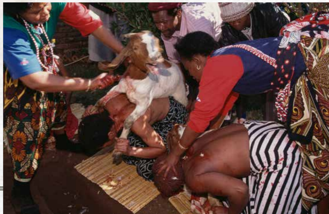
GEIT VAN DE REKENING. Initiatie van nieuwe sangoma door het slachten van een geit.