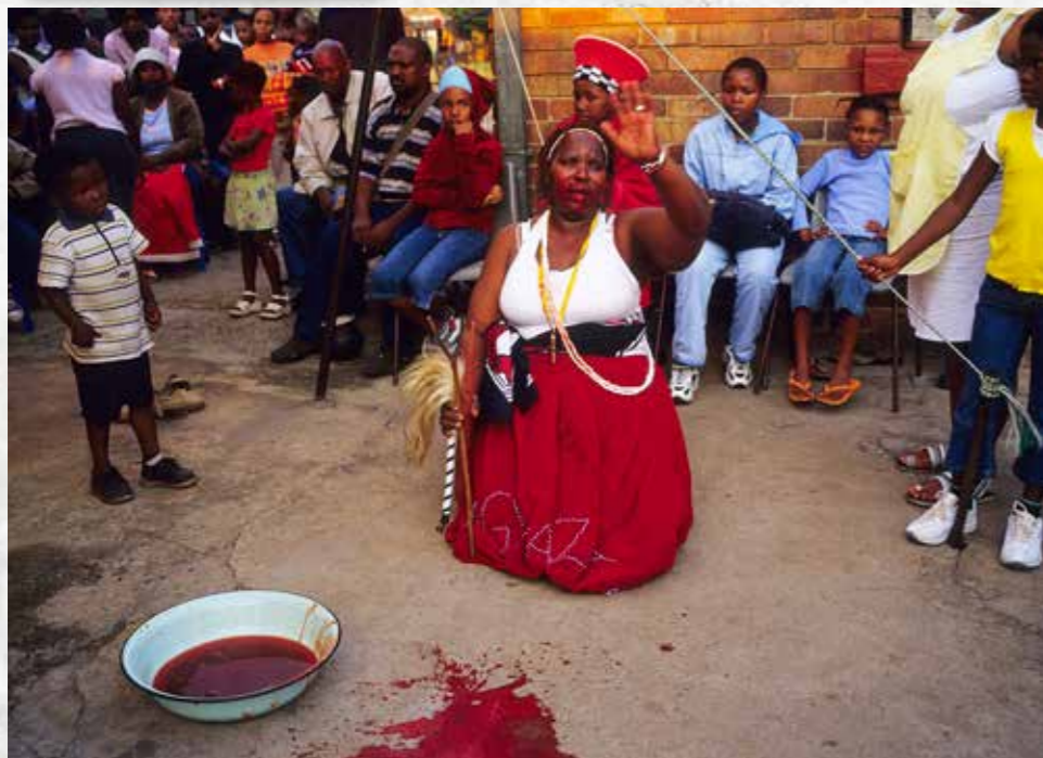
VERS GEITENBLOED. Voor elke kwaal valt het weggeloken van een teiltje geitenbloed aan te raden: succes verzekerd.

journalist ben en hem graag een bezoek wil brengen. Het is stil aan de andere kant van de lijn. Dan vraagt hij of ik ook medicijnen wil. 'Uhm ja,' antwoord ik aarzelend. 'Ik kan je alleen medicijnen geven als je een probleem hebt.' Ik kijk vluchtig op het lijstje met kwalen en ga voor het eerste dat ik zie staan: 'Ik wil mannen leren bevredigen.' Meeten heb ik spijt van mijn keuze. De loterij winnen of gewicht verliezen had meer voor de hand gelegen, en tijdens mijn bezoek straks een stuk minder ongemakkelijk. Ik heb weinig zin in een sexles van een tovenaer. Maar ik kan al niet meer terug. 'Ah, I see. Kom morgen maar langs.' 'Wat gaat er dan gebeuren?' 'Dan vertel ik wat je wil weten en help ik je van je probleem af. Je zal er nooit meer last van hebben,' klinkt het zelfverzekerd. Hij noemt een tijd en adres.