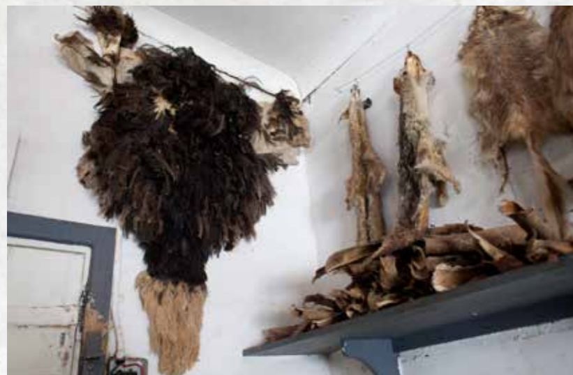
KRUIDEN BUILTJE. Huisvoorraad takken en huiden van de sangoma.