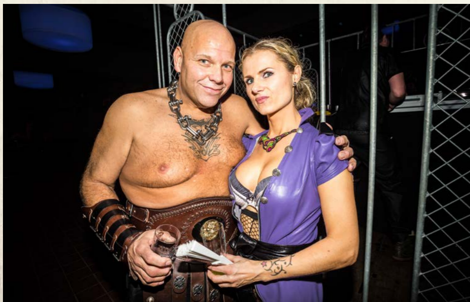
PURPLE PAIN. Hier is niets extreem of raar.