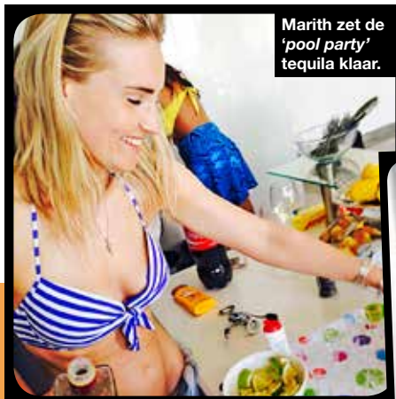
Marith zet de 'pool party' tequila klaar.