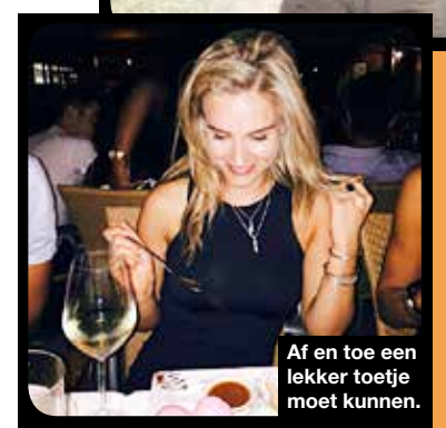
Af en toe een lekker toetje moet kunnen.

maand de huur kunnen betalen. Je kunt zomaar een topklus boeken, of soms zelfs drie per week, maar bijna alle modellen kennen tijden waarin ze helemaal niet werken. En dat vreet aan je. De mooiste vrouwen die ik ken zijn vaak de onzekerste en eigenlijk is dat niet gek. In deze wereld hoor je vaker wat er aan je mankeert, dan wat er mooi aan je is. Je moet altijd afvallen, je hebt te kleine borsten voor lingerie, je bent te lang of te klein voor fashionshows, je haar is te steil of te krullend en je huid is niet glad of strak genoeg. Je gaat je vergelijken met je collega's: waarom krijgt zij die job en ik niet? Zou het helpen als ik iets aan mezelf verander? En dan is er de wetenschap dat looks niet voor altijd zijn. De meeste vrouwelijke modellen worden afgeschreven zodra ze de 35 naderen. En wat dan? Er zijn maar weinig meiden die genoeg verdienen om de rest van hun leven gebakken te zitten.