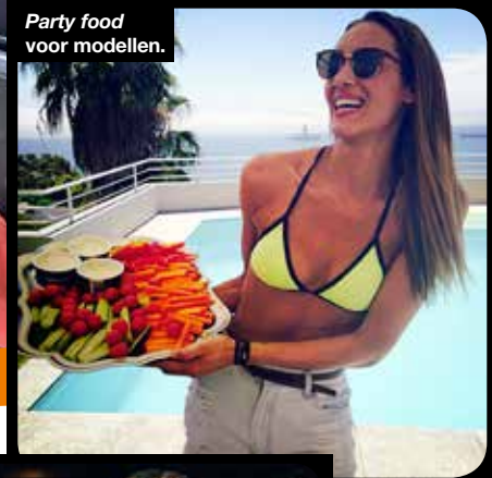
Party food voor modellen.