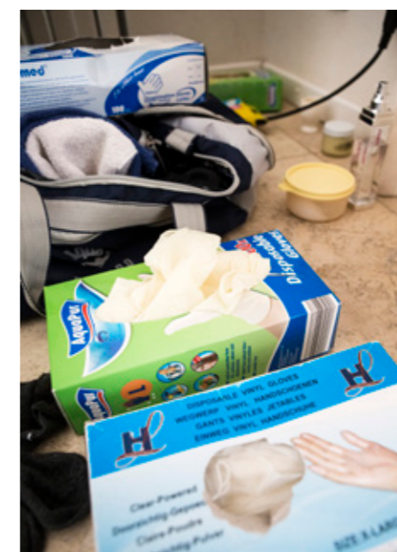
HYGIËNE. Het gebruik van handschoenen 'scheidt afstand, zodat het minder voelt als seks'.