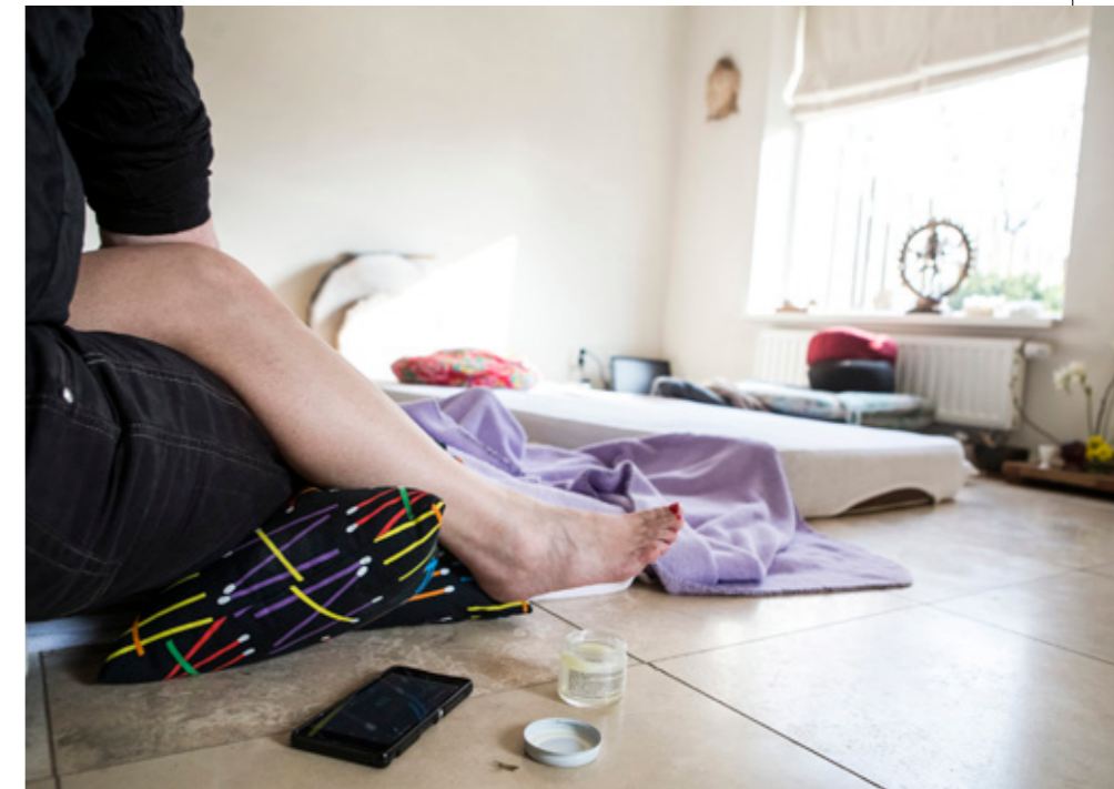
KLAARKOMEN OPTIONEEL. Orgasmeren is geen doel, maar hoeft niet.